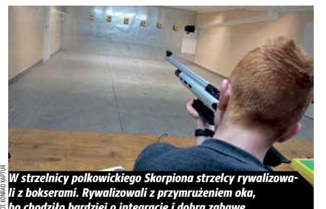
W strzelnicy polkowickiego Skorpiona strzelcy rywalizowali z bokserami. Rywalizowali z przymrużeniem oka, bo chodziło bardziej o integrację i dobrą zabawę.

ZADZWOŃ, CZEKAMY NA TWOJĄ OPINIĘ GAZETA POLKOWICKA TEL. 76 724-97-20