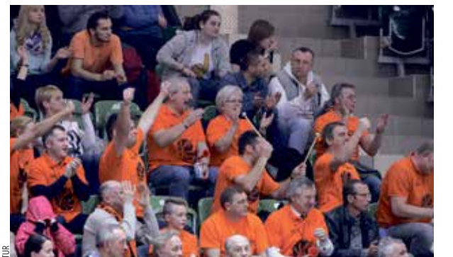
Fani koszykarek CCC Polkowice cieszą się po udanej akcji swojego zespołu w meczu z MKK Siedlce.