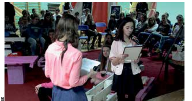
Trwa Polkowska Kampania Chronię życie przed rakiem. We wtorek (3.03) odbyło się spotkanie z młodzieżą w Gimnazjum Nr 2.