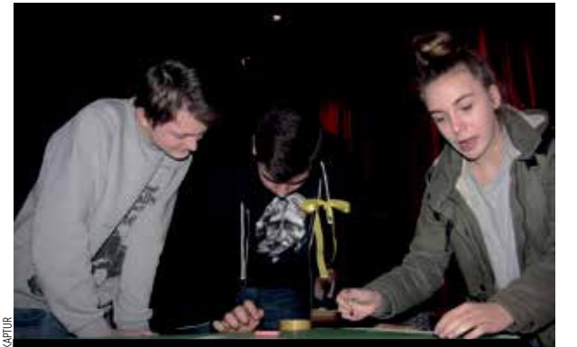
Tydzień Zawodowców w Zespole Szkół. Konkurs wiedzy informatycznej. Uczniowie wykonują jedno z zadań.